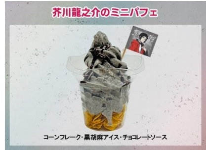
芥川龍之介のミニパフェ 600円(税込)