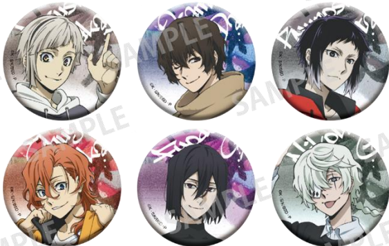
トレーディング缶バッジA(全6種) 400円(税込) ※ランダムに封入して販売の為、絵柄はお選びいただけません。