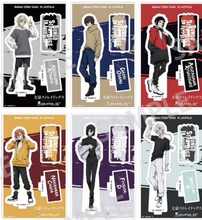
アクリルスタンド(全6種) 各1,600円(税込)