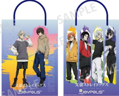
ショッパー(全1種) 600円(税込) ※「アニメイト通販」での販売はございません。