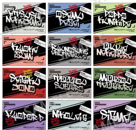
トレーディングミニカード(全12種)

・「パスポート」(入場+アトラクション乗り放題+トレーディングミニカード+パスケース):大人 5,800円 / 小中高生 4,800円