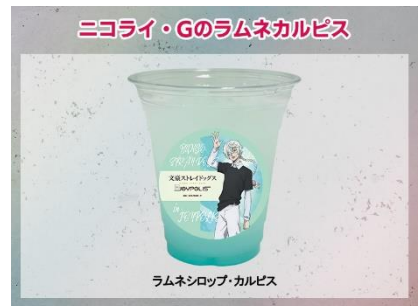
ニコライ・Gのラムネカルピス 600円(税込)