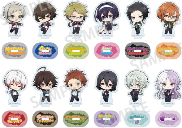
トレーディングミニアクリルスタンド(全12種) 900円(税込) ※ランダムに封入して販売の為、絵柄はお選びいただけません。