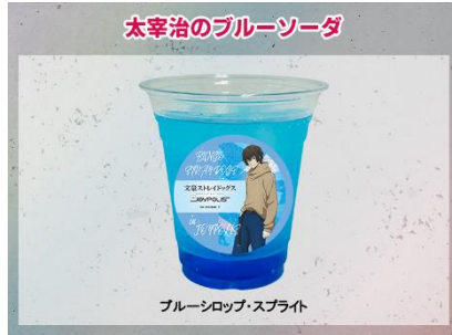
太宰治のブルーソーダ 600円(税込)