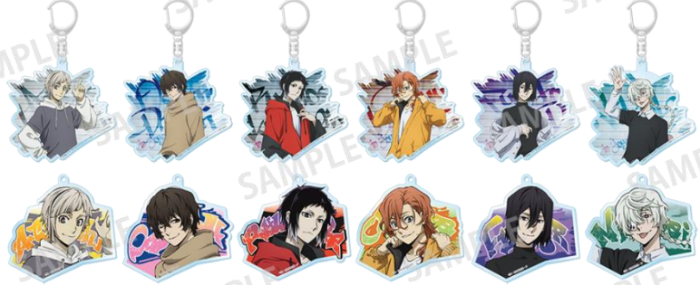
トレーディングアクリルキーホルダー(全12種) 900円(税込) ※ランダムに封入して販売の為、絵柄はお選びいただけません。