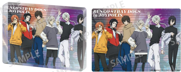
アクリルブロック(全1種) 3,500円(税込)