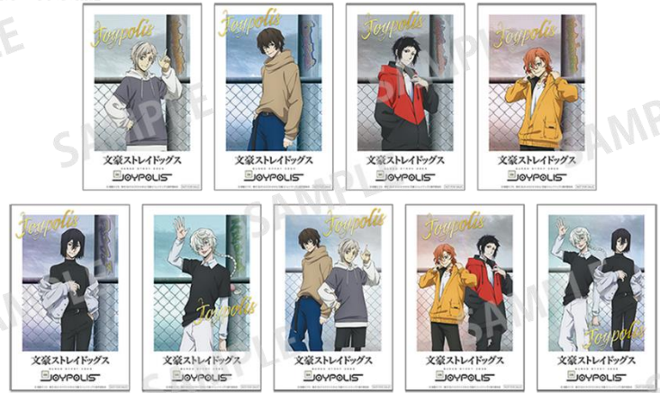
当たり:トレーディングステッカー-A(全9種) ※ランダムでのお渡しの為、絵柄はお選びいただけません。