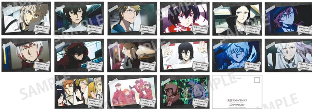
参加賞:トレーディングポストカード(全15種) ※ランダムでのお渡しの為、絵柄はお選びいただけません。