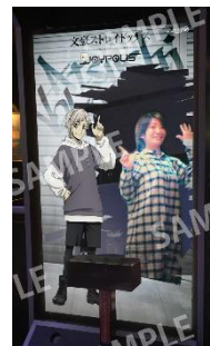
デジタルコンテンツ イメージ