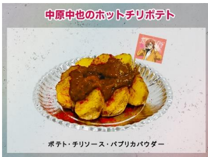
中原中也のホットチリポテト 600円(税込)