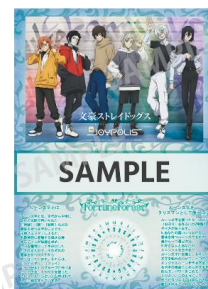
「フォーチュンフォレスト」 占い結果診断用紙イメージ