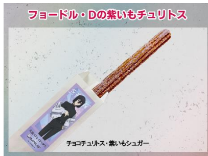
フョードル・Dの紫いもチュリトス 600円(税込)