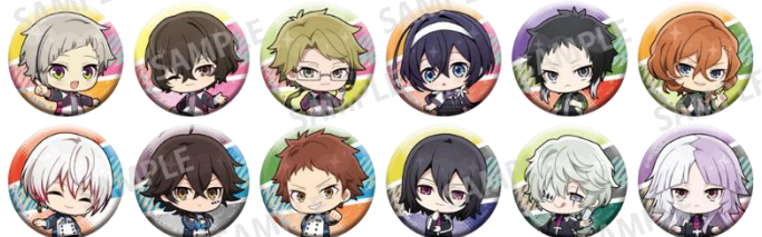
トレーディング缶バッジ B(全12種) 400円(税込) ※ランダムに封入して販売の為、絵柄はお選びいただけません。