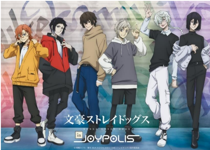
<イベントメインビジュアル>

CAセガジョイポリス株式会社(本社:東京都品川区、代表取締役:吉本 武)が運営する東京・台場の屋内型テーマパーク「東京ジョイポリス」は、TVアニメ『文豪ストレイドッグス』と初のコラボレーションイベント『文豪ストレイドッグス in JOYPOLIS』を、2023年12月27日(水)から2024年2月25日(日)まで開催いたします。