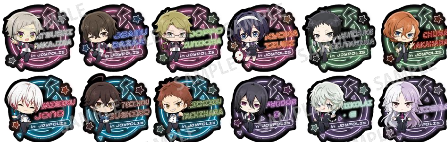
当たり:トレーディングステッカー-B(全12種) ※ランダムでのお渡しの為、絵柄はお選びいただけません。