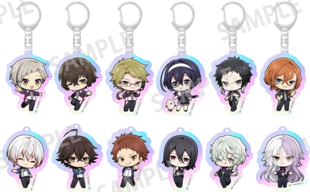
トレーディングオーロラチャーム(全12種) 800円(税込) ※ランダムに封入して販売の為、絵柄はお選びいただけません。