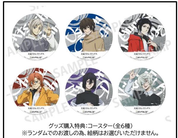
グッズ購入特典:コースター(全6種) ※ランダムでのお渡しの為、絵柄はお選びいただけません。