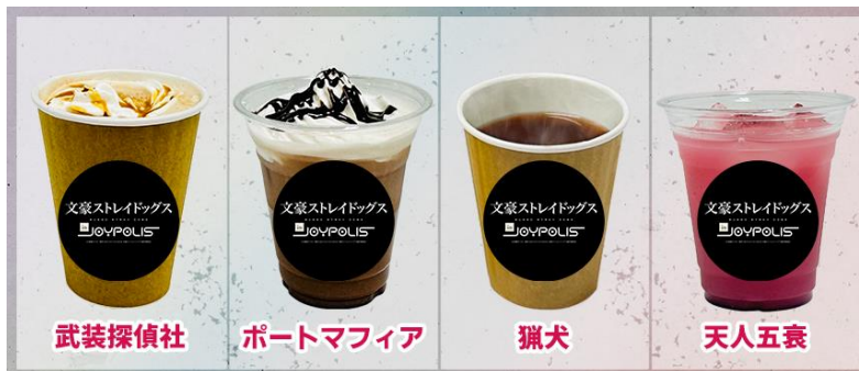
コラボドリンク(全4種) 各600円(税込) 左から:武装探偵社、ポートマフィア、獵犬、天人五衰