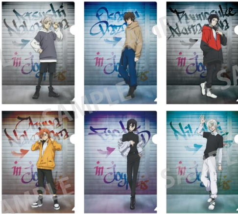
大当たり:トレーディングクリアファイル(全6種) ※ランダムでのお渡しの為、絵柄はお選びいただけません。