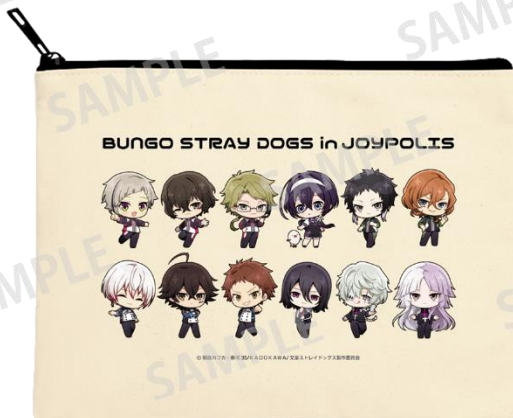
キャンバスポーチ(全1種) 2,000円(税込)