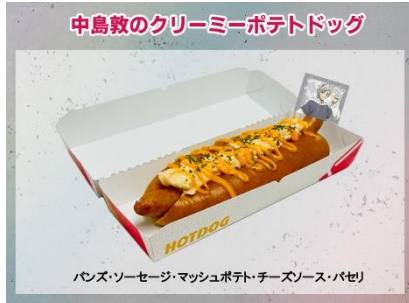
中島敦のクリーミーポテトドッグ 600円(税込)