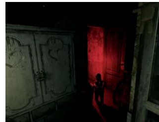
プレイ画面のイメージ