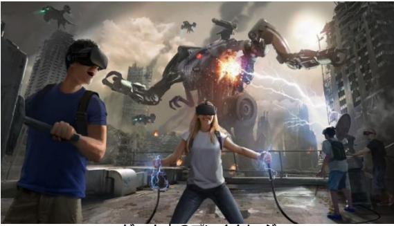
ゲーム中のプレイヤー

最大の特徴は、「ストーリー・リビング」型であるという点です。従来の、VRによってプレイヤーが物語やメッセージを伝えられるという受動的な「ストーリー・テリング」型と異なり、「ストーリー・リビング」型は、VR空間上でプレイヤー自身がまるで存在するかのように自分の物語を作っていくというリアルな没入体験が可能です。触覚フィードバック、モーショントラッキングといった機能も搭載、VR内のアクションを見るだけではなく、感じることも可能。さらに若い世代だけではなく、映画ターミネーターの世代にも楽しんでいただけます。