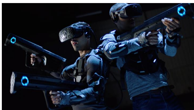
プレイ中の装着イメージ

米国のSPACES社が開発し、日本初上陸となる、映画「ターミネーター」をテーマにしたVR「TERMINATOR SALVATION VR(ターミネーター サルベーション ヴィーアール)」のアトラクションを展開します。