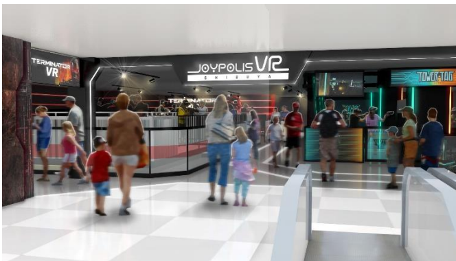
「JOYPOLIS VR SHIBUYA」完成イメージ図