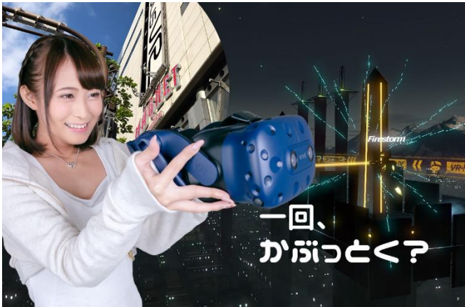
「JOYPOLIS VR SHIBUYA」メインビジュアル

「JOYPOLIS VR SHIBUYA」は、駅から近い立地で、短時間かつ最先端のVRアトラクションを気軽に体験できるVR特化型施設です。提供するの、どれも最先端を極めた3つのVRアトラクション。日本初上陸となり、映画「ターミネーター」の世界に自分も生きているような没入感が魅力の「TERMINATOR SALVATION VR(ターミネーター サルベーション ヴィーアール)」。お台場の「東京ジョイポリス」で今春登場以来、人気を博し、「VR eスポーツ」をコンセプトにした対戦型VRアトラクション「TOWER TAG(タワータグ)」、そしてこちらも日本初上陸、二人で協力しながら進める謎解き脱出型VRホラーアトラクション「THE DOOR(ザ・ドア)」です。 ※さらにコンテンツは追加していく予定です。